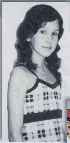
Fotobanner: 40 x 100 cm

Dat we borduren op zowat alles waar een naald doorheen kan, mag op het eerste gezicht vanzelfsprekend zijn, maar is dat toch niet helemaal. Want we nemen de uitspraak “alles waar een naald doorheen kan” wel letterlijk! We hebben óók een reputatie opgebouwd met speciaal borduurwerk. Wat dacht u van het borduren van een hele koeienhuid, van meubelstoffen voor interieurtoepassingen maar ook voor vliegtuigstoelen? Of van lakens voor poker- en blackjacktafels, van vaandels en beschermhoezen voor muziekinstrumenten en foto-borduren op groot formaat? En nog veel meer! Op onze site vindt u voorbeelden van Specials waar u bij het gemiddelde borduurbedrijf tevergeefs voor zult aankloppen. Een van de redenen waarom we dit kunnen doen, is dat we ook borduren op grootformaat. Daarin zijn we uniek in Nederland! En: natuurlijk leveren we alle soorten te borduren textiel en producten tegen groothandelsprijzen.