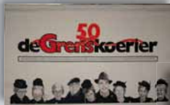
Promodoek, 200 x 100 cm