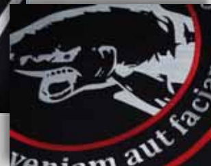
Vaandel 90 x 90 cm