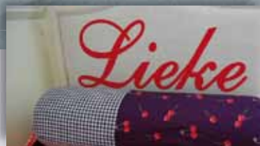
Bedbekleding 80 x 70 cm