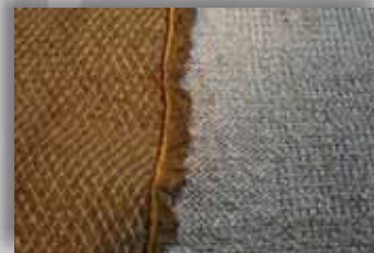
Speciale stoffen 120 x 300 cm

Hoe speciaal wilt u het hebben? We zullen niet gauw “nee” zeggen tegen een uitdaging!