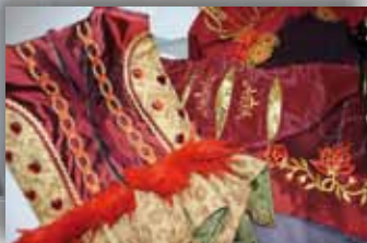
Showkostuums, diverse afmetingen