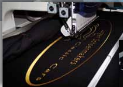
Autohoezen 100 x 40 cm