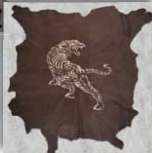
Lederen huid 1.50 x 1.50 cm